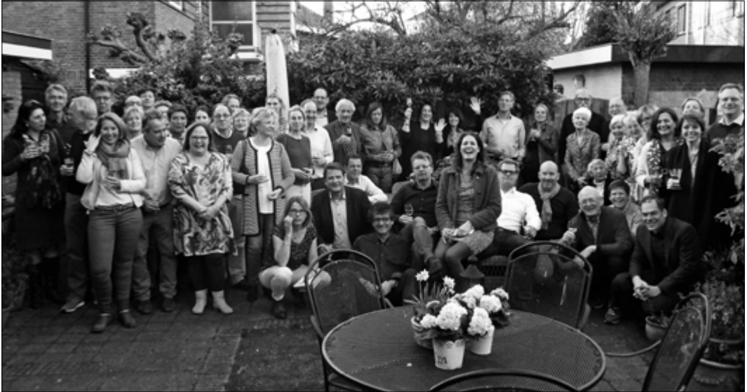
Groepsportret bij de start van het evenement aan de Papegaaiiaan. De deelnemers hebben er duidelijk zin in.

Het Running Dinner dat op zaterdag 25 maart in de wijk werd gehouden, is een nog groter succes geworden dan de eerste editie hiervan, eind oktober vorig jaar. Ook het aantal deelnemers was flink hoger (verdubbeld zelfs) en het sociale eetspektakel strekte zich nu uit over een aanzienlijk groter deel van de wijk.