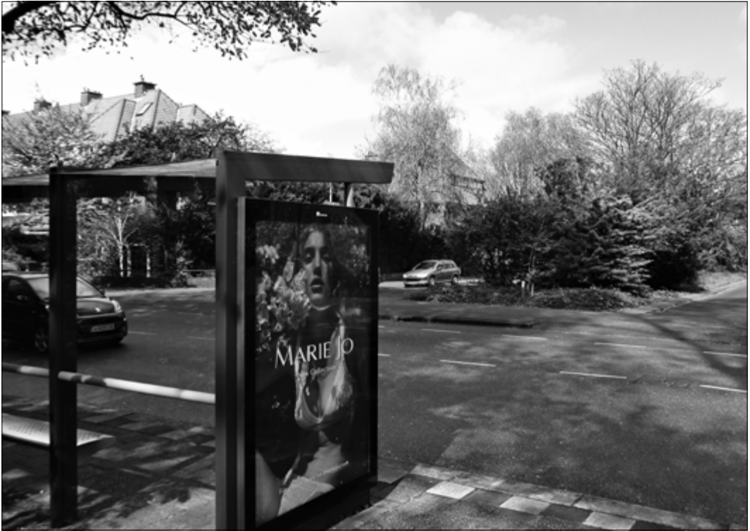
Op de voorgrond de bushalte Vliegvangerlaan richting stad, die komend jaar zo'n 200 meter naar voren wordt verplaatst. Aan de overkant de middenberm van de Vliegvangerlaan, waar de bus richting Kijkduin eind 2018 zal stoppen.

in het nieuwe plan overigens liggen volgens het oorspronkelijke ontwerp, dus vlak na de rotonde. Welke gelijklopende naam de twee nieuwe – tamelijk ver uit elkaar liggende - haltes krijgen is nog niet bekend. Wildhoeftaan-Vliegvangerlaan is wel erg lang.