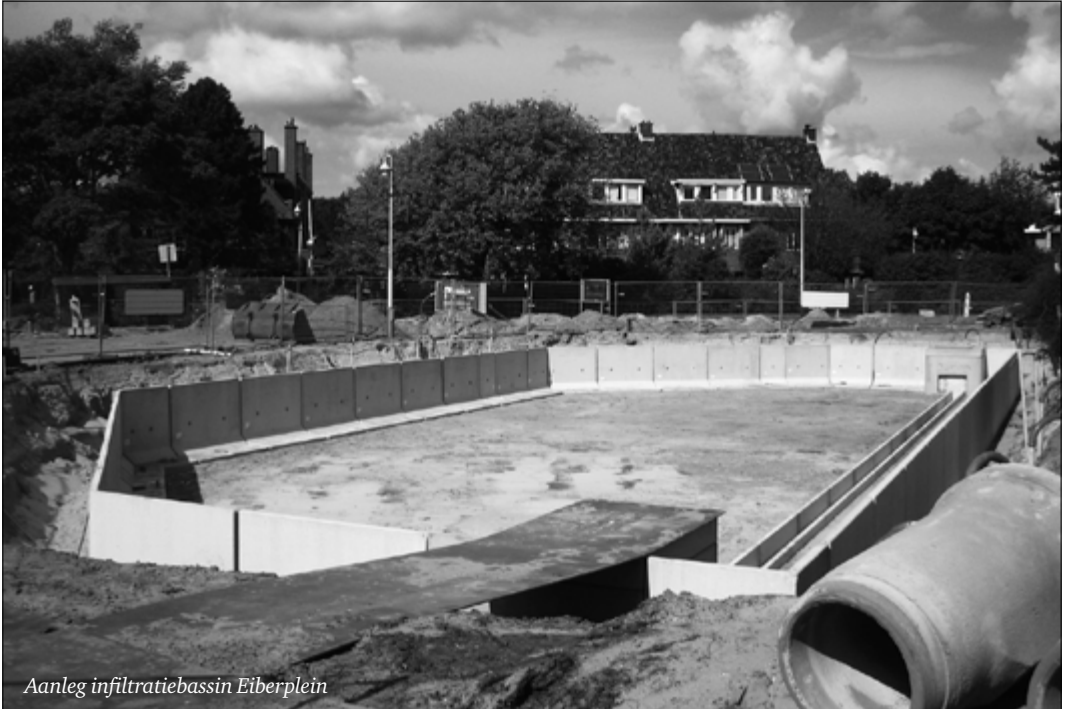
Aanleg infiltratiebassin Eiberplein